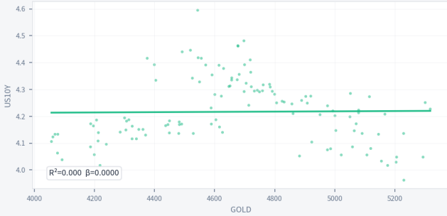
GOLD vs US10Y — 5Y